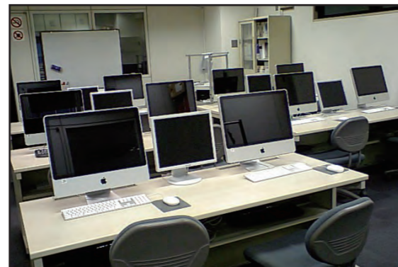
ご協力企業：アップルコンピュータ/アドビシステムズ/エプソン販売/沖データ/キヤノンマーケティングジャパン/クォークジャパン/クラスパレー/コーレル/サイバーリンク/富士ゼロックス/富士フィルム/理想科学工業等各社